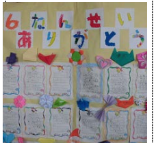
1年生が6年生に 送ったお礼の手紙

第191号 H28. 12. 12 海老名市立 社家小学校 TEL046-238-1453