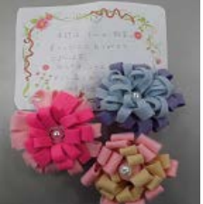
ふれあい教室 講師へのお礼の品 6年生の作品

第190号 H28. 11. 17 海老名市立 社家小学校 TEL046-238-1453