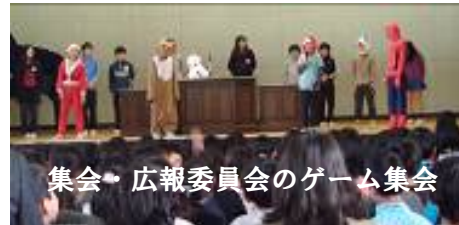
集会 広報委員会のゲーム集会

五年生と六年生が、八つの委員会に分かれて、自分たちの学校生活をよりよくするために活動しています。それぞれの委員会は、日常的な活動として掃除や水やりなど大変な仕事もありますが、みんなのために奉仕する心や学校の一員としての責任感が育っています。