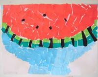
子供の作品 ちぎり絵の スイカ

第163号 H 26. 7. 16 海老名市立社家小学校 Tel.046-238-1453