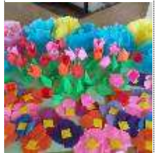
図書室 春のレイアウト

第161号 H26. 5. 12 海老名市立社家小学校 Tel.046-238-1453